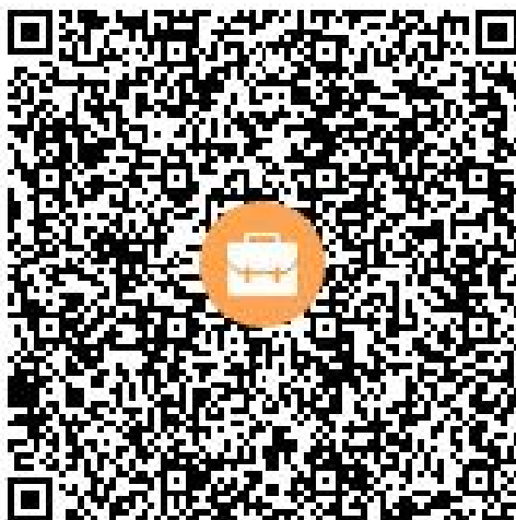
(图 2 管理员 QQ 群: 200843678)

说明: 请各单位管理员于 10 月 25 日前通过扫描上面的微信二维码, 线上填报有关信息; 请通过扫描上面的 QQ 群二维码, 加入 2024 年山东省继续教育数字化共享课程遴选管理员 QQ 群, 便于及时接收通知。管理员账号将通过 QQ 群反馈。