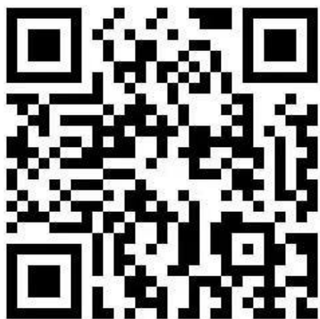
(图 1 管理员信息填报小程序)